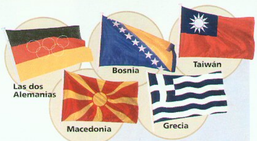
Las dos Alemanias

7 TRAS REALIZAR la división en unidades, se cose y remata cada bandera; después se le ponen los enganches, la driza y los mosquetones.